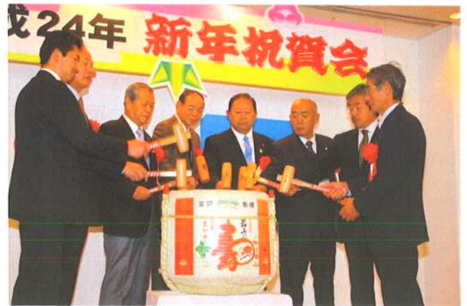
1月5日(木)新年祝賀会