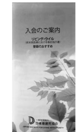
日本尊厳死協会パンフレット

リビングウィルとは「生きている時の意思」の意味で実際には終末期医療における事前指示書。「自分の命が不治かつ末期であれば、延命措置を施さないで欲しい」と宣言することです。 現代の医療では人を生かし続けることがかなり可能になってきています。人工呼吸・胃ろうなどをただ延命のためのために行うことに私は疑問を感じています。これらを控え、苦痛を取り除く緩和に重点を置く医療に最善を尽くしてもらおう。こんな考えを支援している組織が日本尊厳死協会です。自然経過(平穏死・尊厳死)を望むものであり、死期を早めるための措置(安楽死)を望むものではありません。私も尊厳死協会会員(年会費2千円)です。私の会員カードの裏面には以下のような宣言書が書かれています。 この指示書は、私が健全な状態にある時に書いたものであります。したがって、私の精神が健全な状態にある時に私自身が破棄するか、または撤回する旨の文書を作成しない限り有効であります。 ① 私の傷病が、現代の医学では不治の状態であり、既に死が迫っていると診断された場合には、ただちに死期を引き延ばすためのだけの延命治療はお断りいたします。