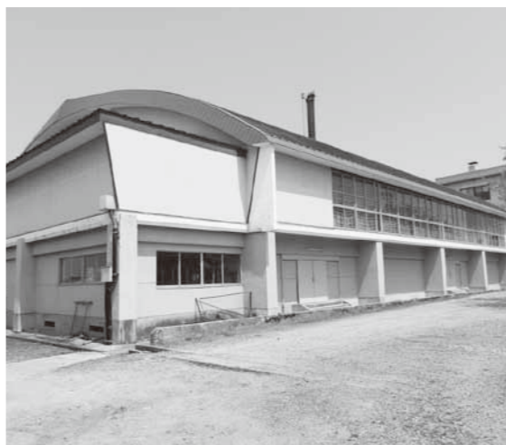
改築予定の新庄東高校体育館