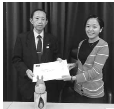
親書と共に「杉の妖精」も

市に切り替えられないか検討した。黄教育科長も「既に山形県には市内2校が修学旅行で行っている。金山から生徒が来れば、学校を紹介