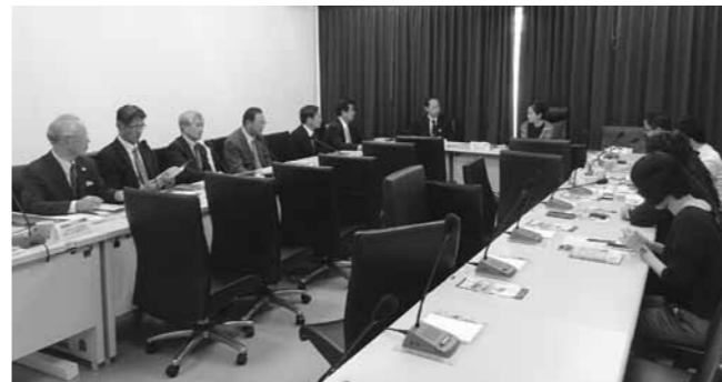
高雄市観光局での要請

今後に弾みをつけるべく、町議会議員も全員で歓迎し、大いに交流を深めている。翌日は最上川、蔵王、天童泊、最終日は、松島だつ