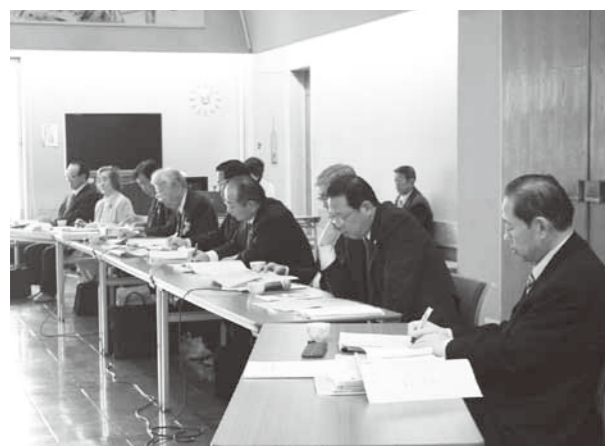
真剣な議論 予算特別委員会

一般会計予算 平成27年度一般会計予算は、歳入歳出それぞれ43億2500万円で、前年度対比22.8%の増となっております。歳入においては、全体の9.6%を占める町税は4億1623万円で、前年度に対して200万円、率にして0.5%の減となっております。 歳出においては、投資的経費が前年度に対して6億4235万円、率にして12.0%と大幅増となりました。これは貸工場設置事業により、企業誘致を図るものと、若者の定住を促進する街なか公営住宅整備事業などによるものとなっております。