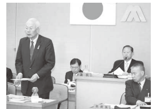
町長の施政方針説明

3月定例会は、3月4日から10日までの7日間の会期で開かれました。新年度にあたって町長の基本的方針表明があり、町長から提案された平成27年度一般会計予算、6特別会計予算のほか26年度補正予算、条例の制定などの28議案を慎重に審議し、いずれも可決しました。(予算審議はP4～P7記載) 一般質問では4人の議員が、旧校舎の活用、地方創生の対応、(新)適時適育の進め方、県立新庄病院改革による安心安全な圏域実現について厳しく問いただしました。