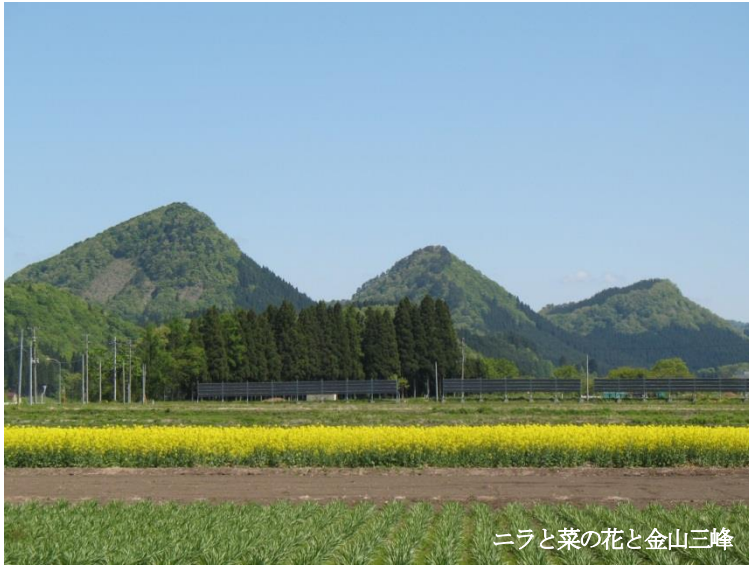
ニラと菜の花と金山三峰