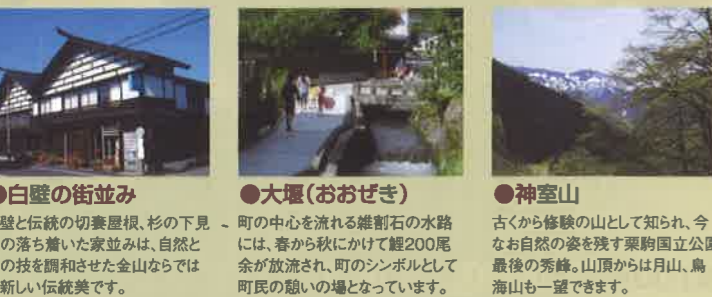
●白壁の街並み 白壁と伝統の切妻屋根、杉の下見板の落ち着いた家並みは、自然と匠の技を調和させた金山ならではの新しい伝統美です。 ●大堰(おおぜき) 町の中心を流れる雄割石の水路には、春から秋にかけて200尾余りが放流され、町のシンボルとして町民の憩いの場となっています。 ●神室山 古くから修験の山として知られ、今なお自然の姿を残す栗駒国立公園最後の秀峰。山頂からは月山、烏海山も一望できます。