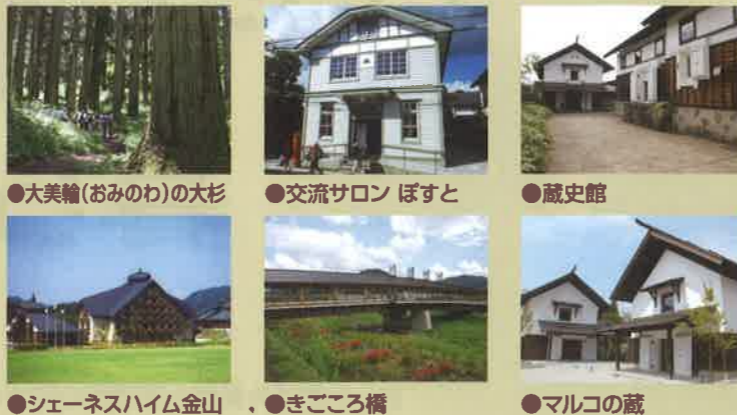
●大法輪(おみのわ)の大杉 ●交流サロン ほすと ●蔵史館 ●シェネスハイム金山 ●きごころ橋 ●マルコの蔵