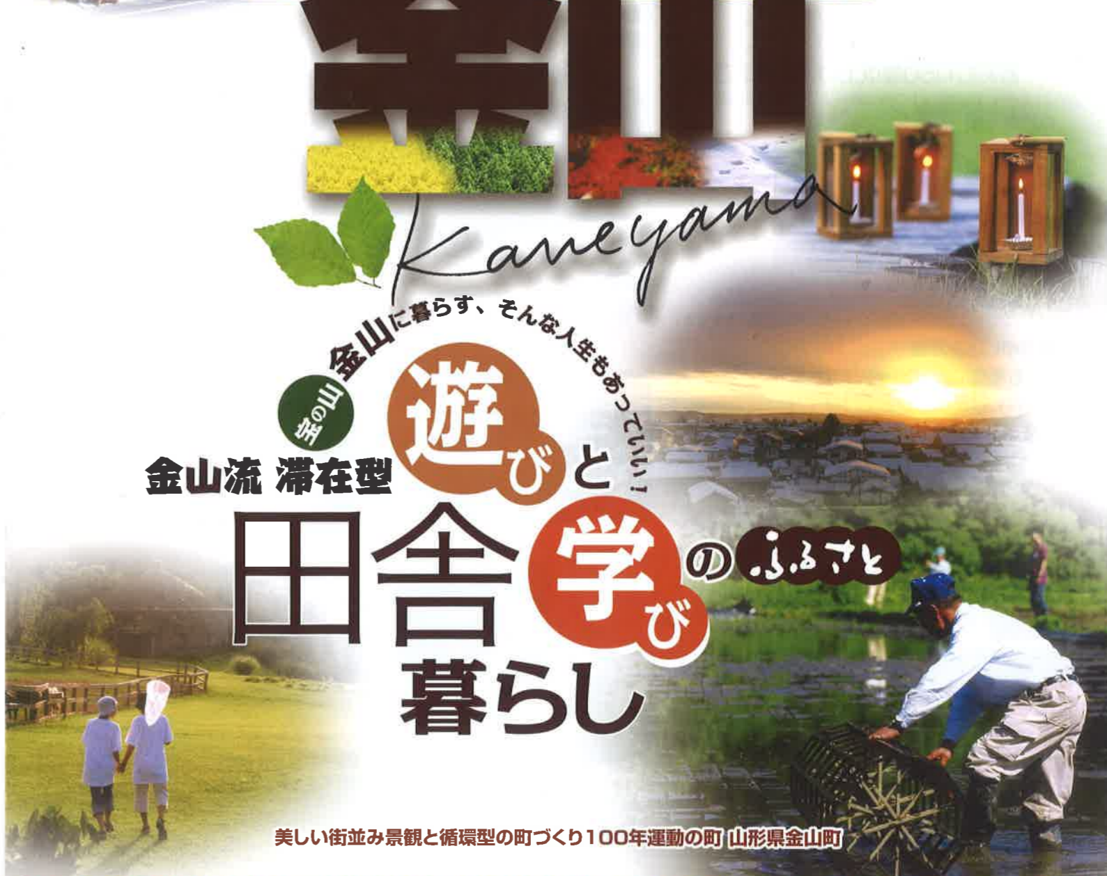
美しい街並み景観と循環型の町づくり100年運動の町 山形県金山町

お問い合わせ ● SUI〜と係 (金山町役場総務課内) TEL.0233-52-2111 FAX.0233-52-2004