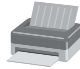
インクジェットプリンタ(インクは外す)