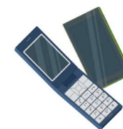
携帯電話・スマートフォン