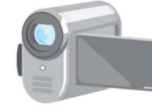
デジタルビデオカメラ